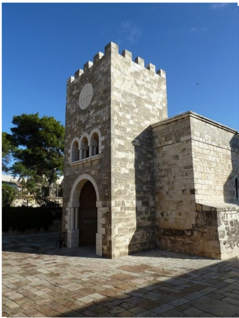
Bethphage templom, Jeruzsálem

Bűnbánati istentisztelet: szerda 18 óra csütörtök 18 óra Istentisztelet: nagypéntek 9 óra Nagyszombati áhítat: nagyszombat 16 óra Ünnepi istentisztelet úrvacsorával: húsvétvasárnap 9 óra húsvéthétfő 9 óra